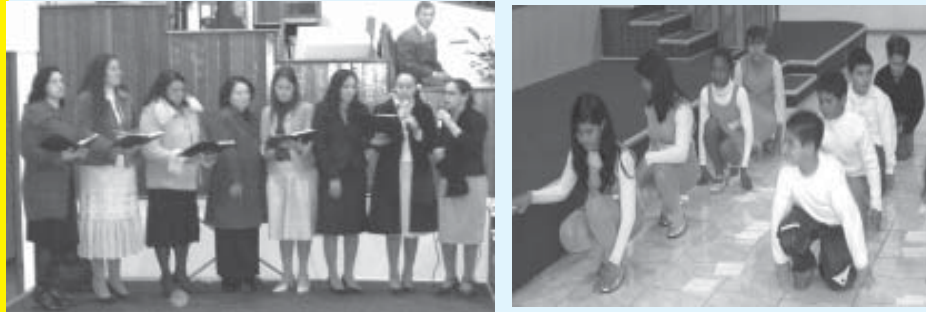
Na foto: coral das esposas de militares e policiais civis, a coreografia das crianças.