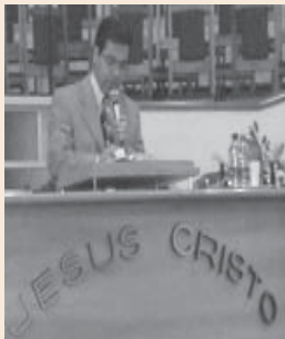
Nas fotos: momentos do Simpósio: