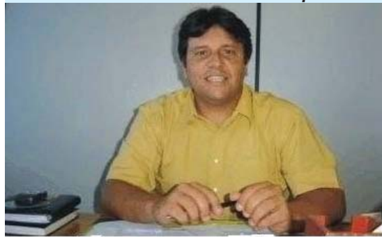
AS CIDADES DEVEM PROMOVER A VIDA. LEMBRA CAMPANI