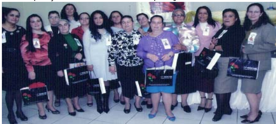
Na foto as irmãs da Congregação de Capão da Canoa.

Foi um envolvimento espiritual com todas as congregações presentes com muito amor, louvor, adoração, mas em especial um grande e abençoado Estudo Bíblico onde Deus evidenciou sua aprovação derramando sobre todo o seu poder glorioso.